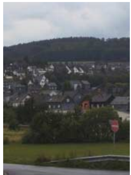
-Im Gemeindegebiet wird traditionell die dunkle Dacheindeckung bevorzugt-