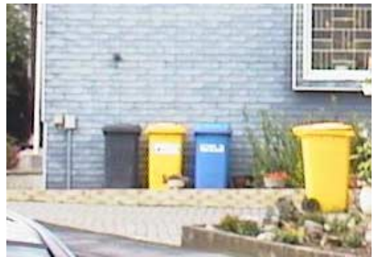
- Abfallbehälter sollten verdeckt untergebracht werden-