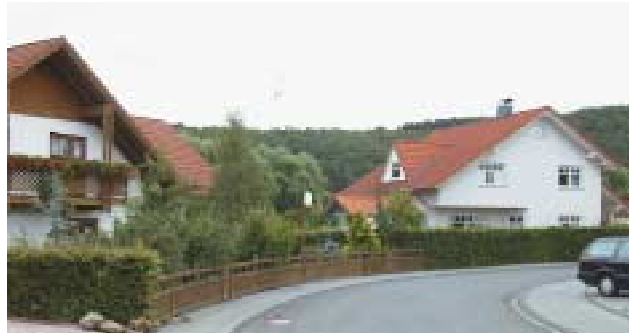
-Gutes Beispiel für Einfriedungen mit heimischen Hecken und Holzzaun mit senkrechter Lattung-

Einfriedungen zur Straße und zu den seitlichen und hinteren Grundstücksgrenzen sind zulässig. Auf die Bestimmungen des Nachbarrechtsgesetzes wird hingewiesen.