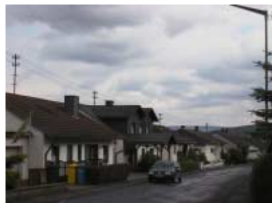
-Übergroße Dachaufbauten stören eine harmonische Dachlandschaft-

Die Dachaufbauten dürfen in der Summe der Breite max. 1/3 der Gesamtfirstlänge aufweisen.